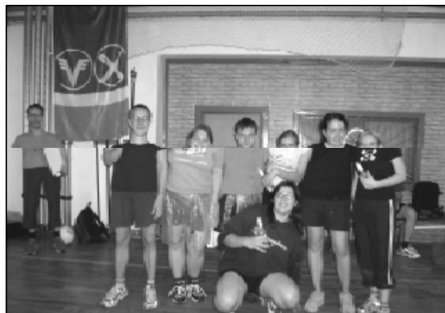
Dritter Platz im Volleyballturnier des Anfängerkurses: Die Protegeros de la Tortuga.