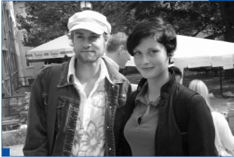
Semesterbeginn für das Wintersemester 2005/2006: Etwa 3000 Bewerbungen um einen Studienplatz an der Hochschule Merseburg (FH) gingen beim Amt für Akademische Angelegenheiten ein.