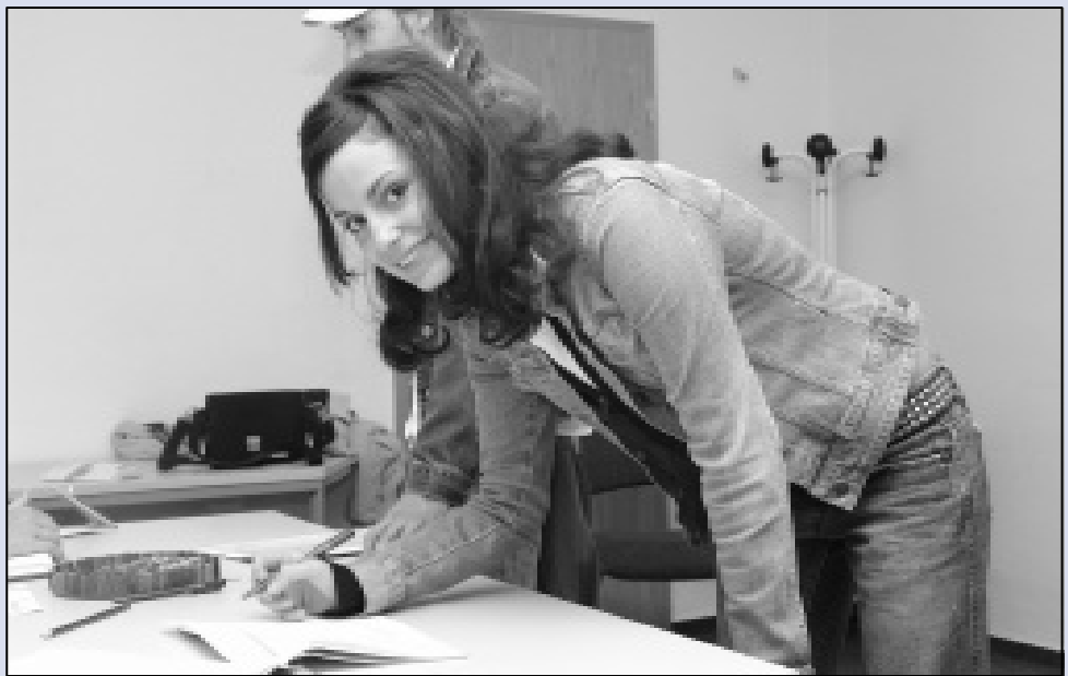
Am 14. und 15. September fanden die Einschreibungen beim Dezernat für Akademische Angelegenheiten statt.

Endgültige Studierendenzahlen folgen in der nächsten Ausgabe.