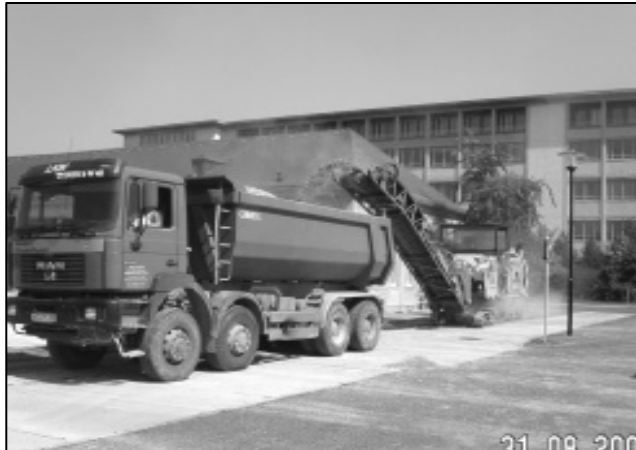
Abtragen der Straßendecke an den Gebäuden 145 und 149 mit schwerem Gerät.

Neben einfachen Seminarräumen gehören unter anderem Computer-Pools, ein Zeichensaal und auch Teile des Schülerprojekts „Chemie zum Anfassen“ dazu. Dafür wurden und werden Wände entfernt und neue eingezogen, Fußböden und Installationsschächte sowie die Elektro- und Dateninstallation