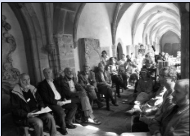
Die Teilnehmerinnen und Teilnehmer während des Vortrages von Dr. Bernd Janson, Kanzler der Hochschule Merseburg (FH)

Evangelische Studentengemeinde lud ihre Ehemaligen ein