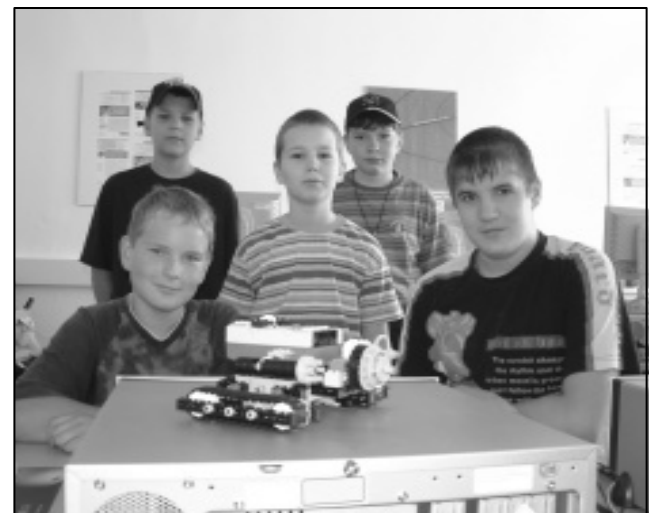
Schnupperkursteilnehmer mit Mindstorms-Roboter

Mehr Informationen zum Wettbewerb im Internet unter www.firstlegoleague.org