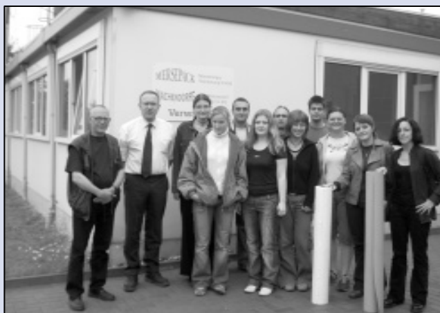
Die Exkursionsteilnehmerinnen und -teilnehmer zur in unmittelbarer Nachbarschaft zum Campus gelegenen Mersepack GmbH