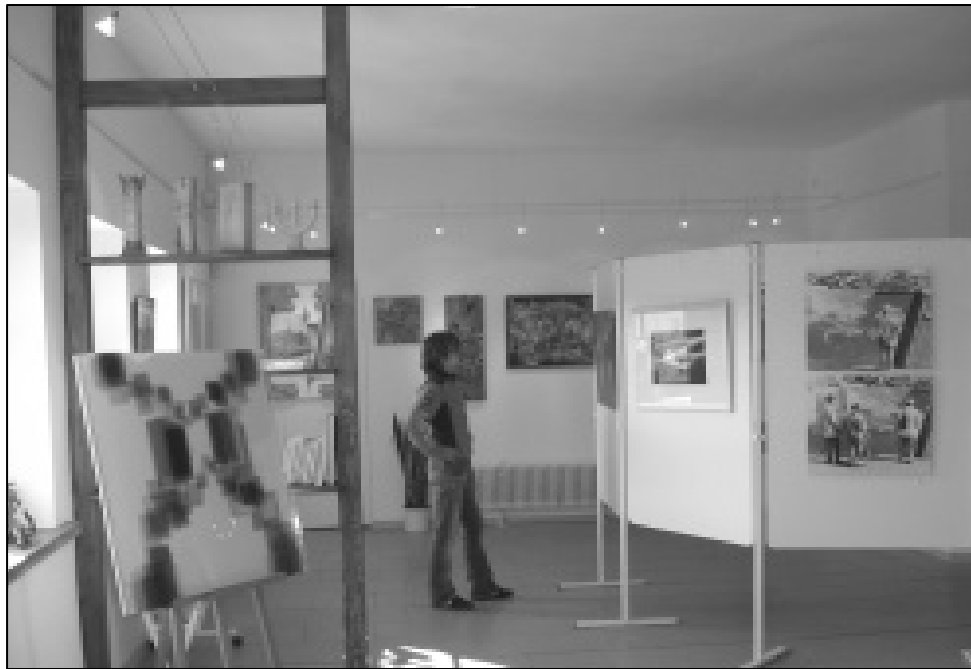
Die hellen und gegliederten Räumlichkeiten im Tiefen Keller boten in diesem Jahr die Grundlage für eine gelungene Präsentation.