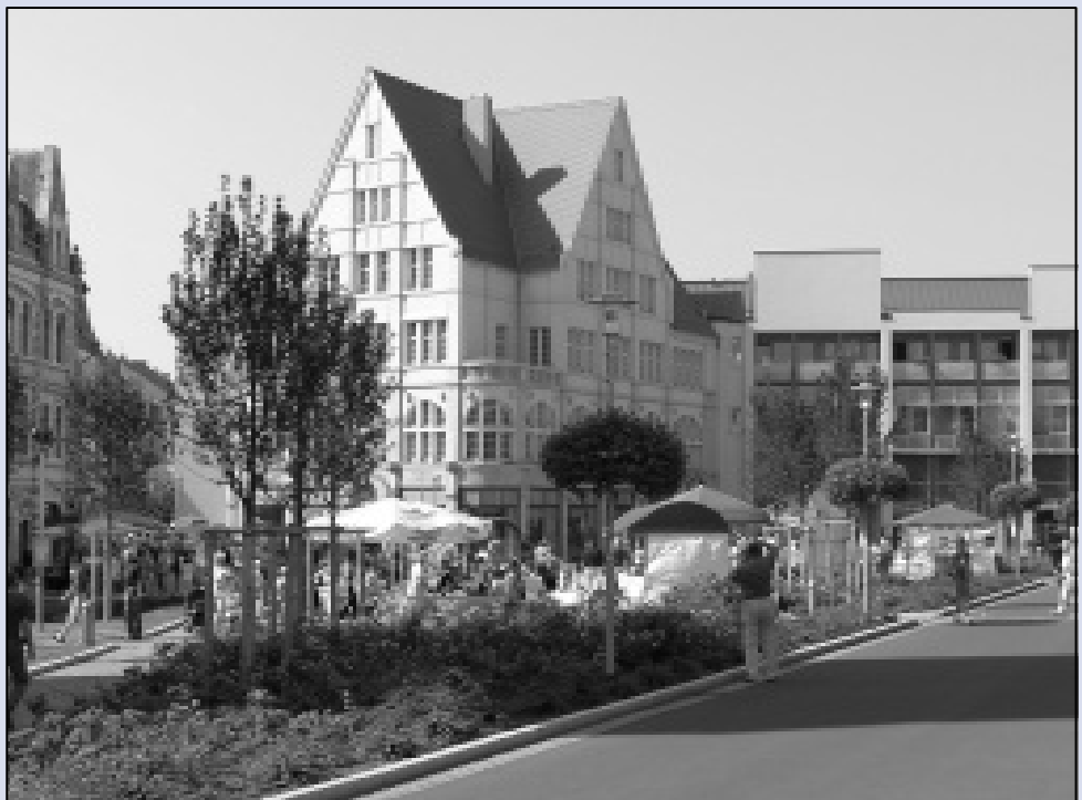
Ansicht aus der attraktiven Merseburger Innenstadt: Am Entenplan

In Merseburg und in unmittelbarer Umgebung gibt es übrigens mehr als 11 000 Arbeitsplätze im produzierenden Bereich. Das ergibt eine Quote, die im Osten Deutschlands wohl kaum eine andere Gemeinde aufzuweisen hat. Der Vermögenshaushalt der Stadt betrug in den letzten fünf Jahren zusammen etwa 100 Millionen Euro.