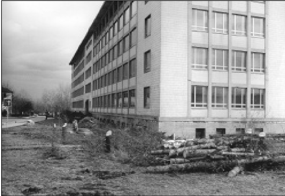
Nackt und kahl präsentiert sich seit Ende März das Hauptgebäude. Die Fällungen erregten viele Hochschulangehörige.

Anfang Juni beginnen am Hauptgebäude der Hochschule Merseburg die Rohbauarbeiten. Auch für die Sanierung des Gebäudes 130 wurde inzwischen der noch ausstehende Bauauftrag erteilt. Neben den Arbeiten im Rahmen der Campussanierung laufen zurzeit die Planungen für notwendige Arbeiten am Gebäude 144.